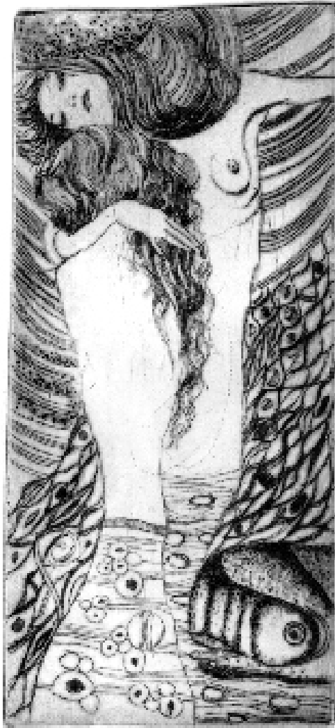
Hering isit suka isit